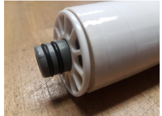
Oberes Ende der Membran mit kleinen Dichtungsringen (A)